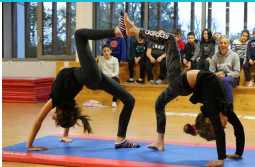
Découverte du sport pour les jeunes Montois.

Pour cette période, retrouvez les activités suivantes :