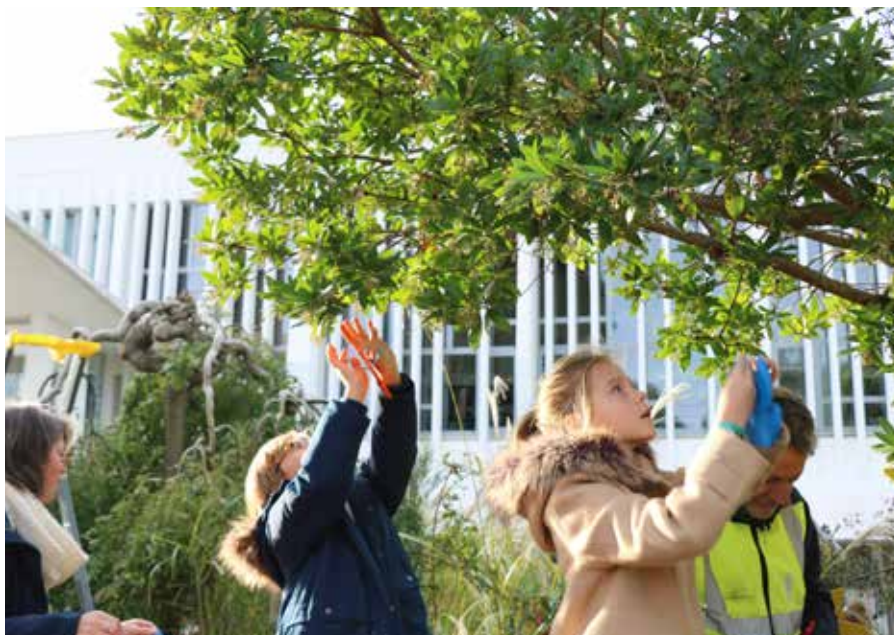
Les enfants ont accroché des colombes, symbole de paix, devant l'Hôtel de ville.

La ville de Saint-Jean-de-Monts est « Ville amie des enfants » depuis 2006. Les actions de la ville sont très intéressantes et dénotent une réelle volonté de faire du bien-être de l'enfant une question centrale. »