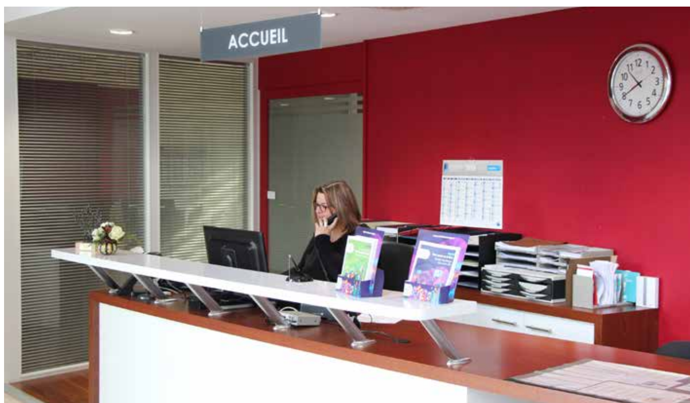
Hôtel de ville : un accueil ouvert du lundi au samedi.

Les agents enregistrent et gèrent les actes d'état civil comme les mariages, les naissances, les décès, les reconnaissances d'identité, les certificats d'hébergement. Les agents s'assurent de la bonne tenue des listes électorales et assistent le maire et les adjoints dans leur fonction d'officier d'état civil. Tous les 5 ans, ils coordonnent le recensement de la population.