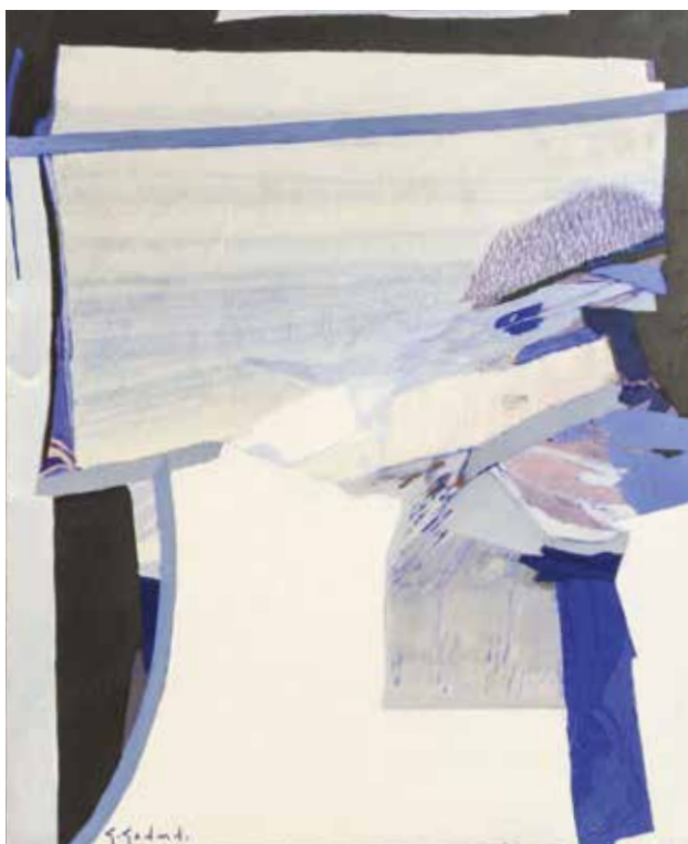
Plusieurs œuvres de Gabriel Godard sont présentes dans les collections de la Ville.

Alors que plusieurs de ses œuvres sont acquises par l'État Français pour différents musées, dont le Centre Georges Pompidou ou le Musée d'Art Moderne de Paris, la Commune de Saint-Jean-de-Monts a elle aussi l'honneur d'avoir plusieurs peintures de l'artiste dans sa collection.