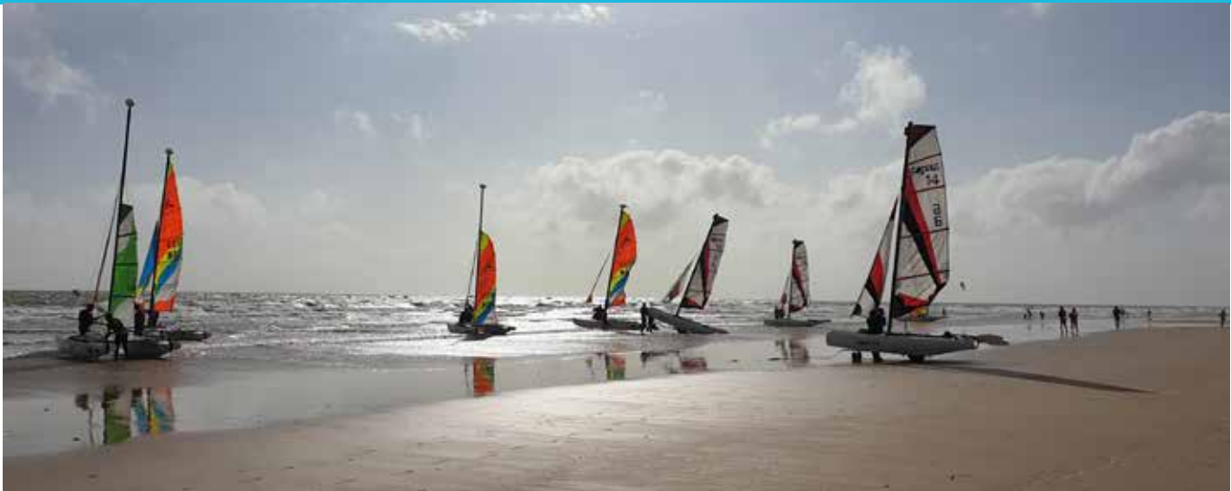
Sports nautiques toute l'année à Saint-Jean-de-Monts.