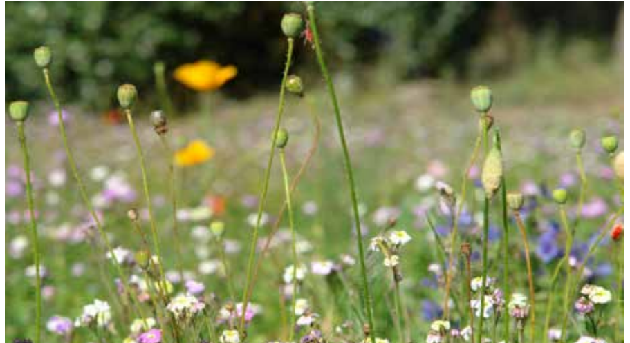
Des mauvaises herbes... Pas si mauvaises.

Vous l'avez peut-être remarqué, les rues de Saint-Jean-de-Monts deviennent parfois le lieu de croissances végétales improvisées. N'allez pas croire que les agents de la Ville travaillent moins, au contraire. La Ville a une volonté assumée d'arrêter l'utilisation des produits dangereux pour l'environnement. Une bonne occasion pour tous de contribuer à la création de notre cadre de vie.