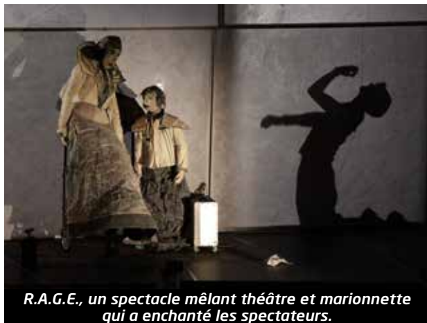
R.A.G.E., un spectacle mêlant théâtre et marionnette qui a enchanté les spectateurs.