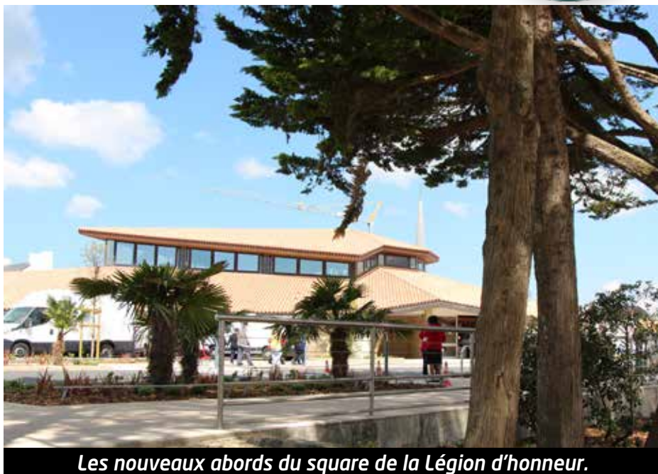
Les nouveaux abords du square de la Légion d'honneur.

Depuis mai 2017, Montois et touristes bénéficient d'une nouvelle place du marché, rénovée pour raviver l'image du centre-ville, mais aussi faciliter la balade à pied et le bien-être. La suppression d'obstacles, l'ajout de bancs et de plantes sont les ingrédients de ce tableau citadin plus agréable. Marc Chevalier, responsable des espaces verts, nous explique comment le choix des végétaux participe à cette mise en scène et fait un point sur ce que signifie « la végétation locale ».